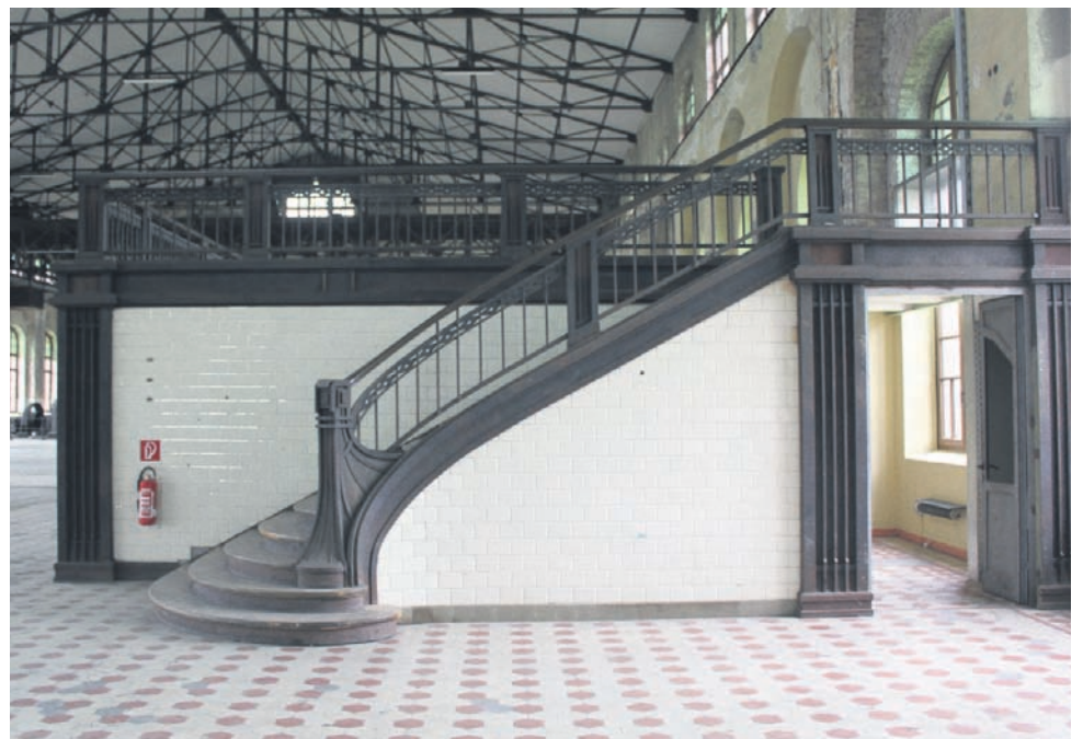
Die herrschaftliche Empore im Jugendstil ist Teil der Maschinenhalle Zweckel, in der gewaltige Umformer einst für den Zechenbetrieb Drehstrom in Gleichstrom umwandelten.

// Infos auf der Internetseite der Industriedenkmalstiftung www.industriedenkmal-stiftung.de oder unter Tel: 0231 / 93112233