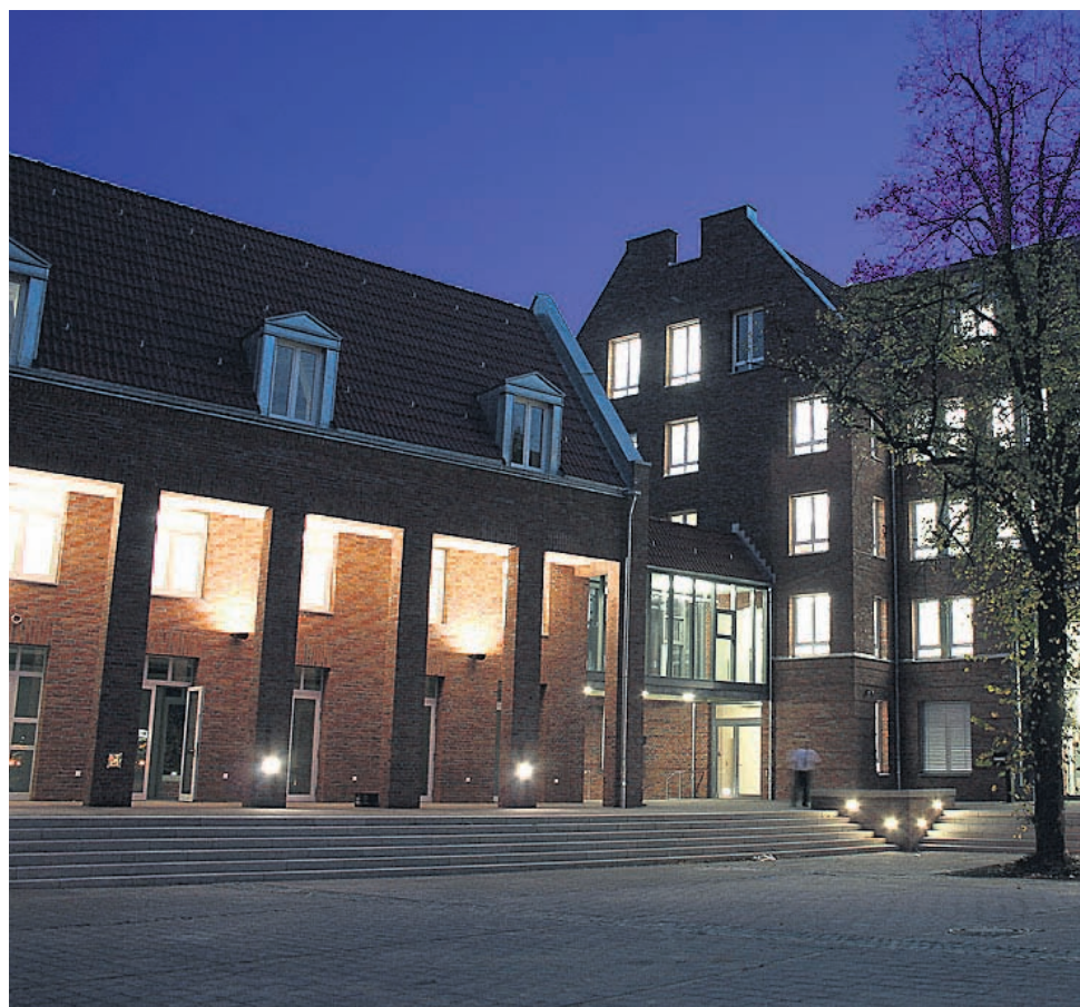
Abends erstrahlt das Neue Rathaus in stimmungsvollem Licht, am Tag ist das Bürgeramt hier erste Anlaufstelle für die Gladbecker bei vielen Verwaltungsangelegenheiten.