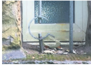
Kennzeichen „G“? Geländer und Fenstergitter tragen auffällige Verzerrungen.

durch das mächtige Haupttor: Links die Sanitäranlagen, rechts das Wettkampfbüro – zahlreiche Plakate an der Wand erinnern innen an die großen Leichtathletikfeste mit internationaler Beteiligung, die Gladbeck zwischen 1989 und 1997 ausrichtete. Im Schaukasten draußen sind die aktuellen Erfolge der Sportler des Turnvereins Gladbeck und des VfL Gladbeck 1921 dokumentiert – die Anlage ist Leistungsstützpunkt des Fußball- und Leichtathletikverbandes NRW.