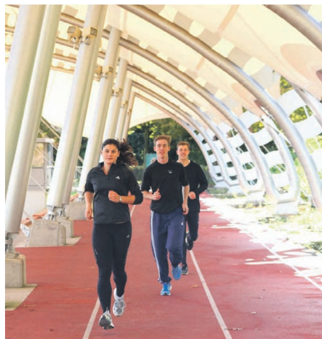
Tartan-Training im Trocken: Das Tribünenenddach schützt Besucher und Sportler vor widrigem Wetter.

Ob zum Training, für einen Spaziergang, als Abkürzung oder bei Wettkämpfen, ob als Sportler oder Zuschauer – es gibt heute viele Gründe, das Gladbecker Stadion zu betreten – und viele Wege führen hinein. Wer sie bewusst beschreitet, kann dort der besonderen Magie dieses Bau-