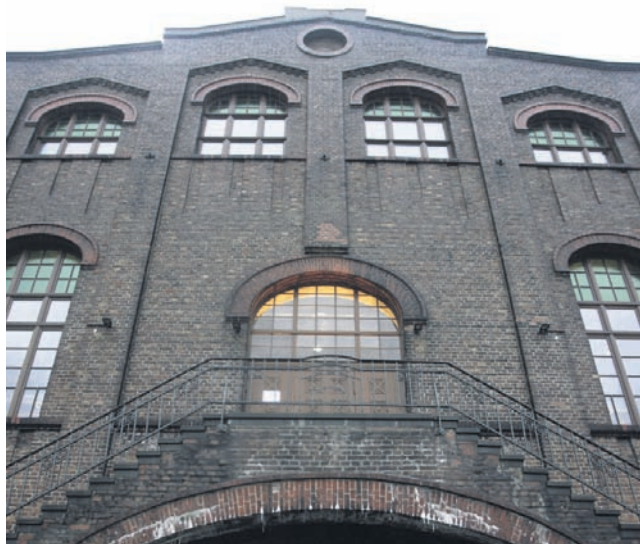
Der Haupteingang der Maschinenhalle ist nur über eine große Backstein-Treppe zu erreichen.