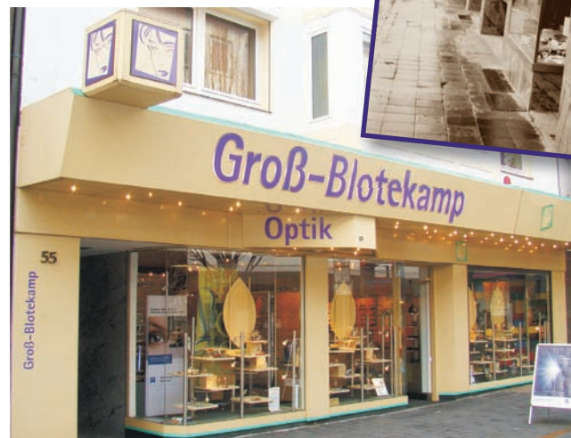
Das Filialgeschäft im Jubiläumsjahr sowie zu Beginn im Jahr 1962.