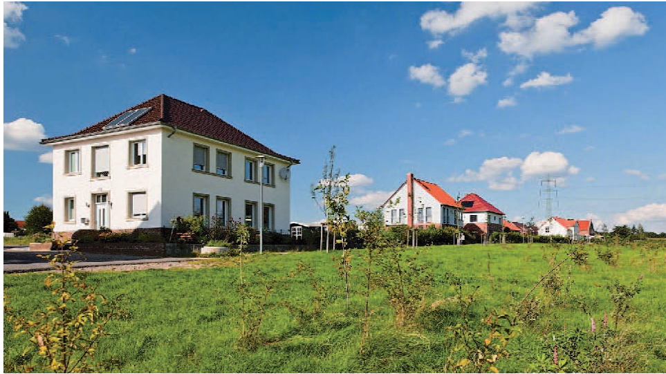
Das Neubaugebiet Wielandgarten im Süden des Stadtgebiets erinnert in seiner Bauweise an die klassische Gartenstadt.