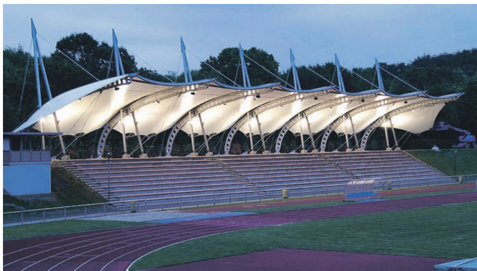
Und abends mit Beleuchtung: Die leichtfüßige Dachkonstruktion der Tribüne.