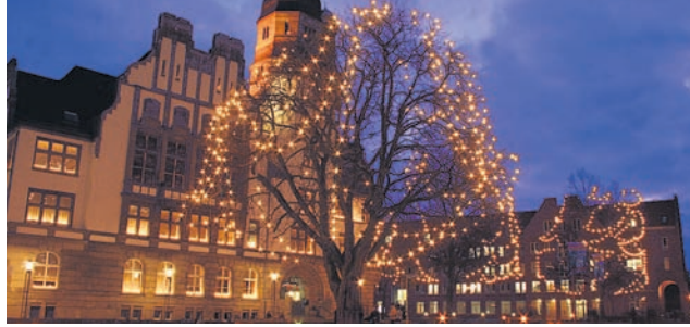
Festlich beleuchtetes Rathaus.

„ Märchenhafte Weihnacht “ finden die Besucher des Wasserschlosses Wittringen von Donnerstag, 29. November, bis Sonntag, 2. Dezember , im Schlosshof. An den vier Tagen sind festlich geschmückte Hütten mit Kunsthandwerk und kulinarische Angebote der Schlossgastronomie angekündigt. Am Donnerstag, 29. November , beginnt um 17 Uhr ein Later-