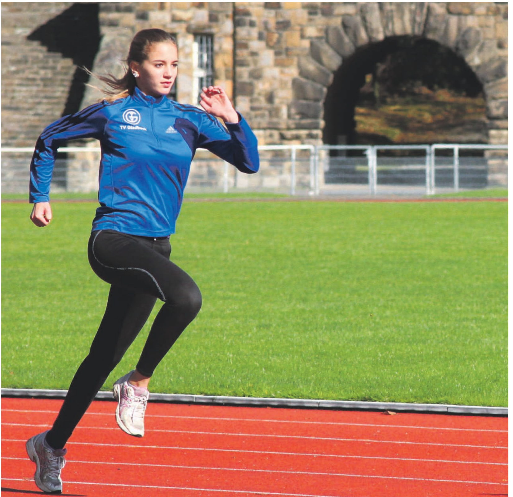
Im Stadion Gladbeck / Foto: Dieter Pfennigwerth