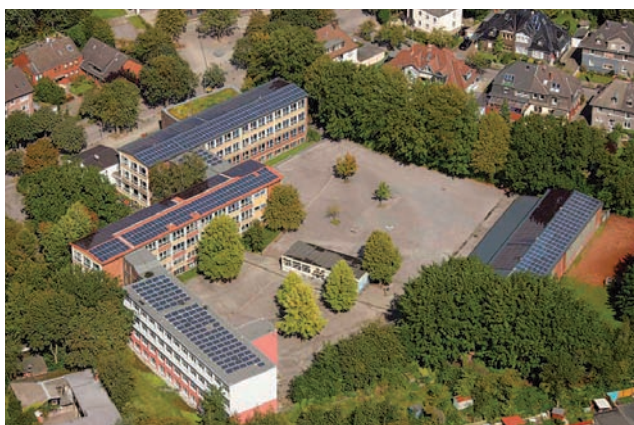
Photovoltaikanlagen auf den Dächern der Anne-Frank-Realschule an der Kortestraße.

Für die Stadt ist die Bürgerenergie ein Leuchtturmpro-