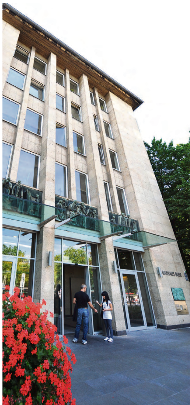
In vier Bürgercentern wie hier im Rathaus Buer können die Gelsenkirchener Verwaltungsangelegenheiten erledigen.

Telefonische Auskünfte werden unter der Sammelrufnummer: 0209 / 169 2100 gegeben. Per E-Mail: buergercenter@gelsenkirchen.de oder per Fax: 0209 / 1692139. Zahlreiche häufig benötigte Formulare stellt die Verwaltung im Internet zum Download bereit unter: www.gelsenkirchen.de in der Rubrik Rathaus/Formulare