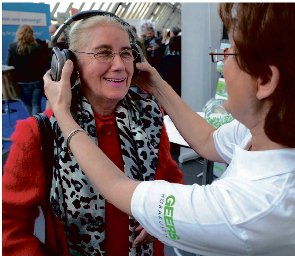
Ein kostenloser Hörtest – auch das ist möglich auf der „Senio“.

„Wohnen im Alter“ ist das Schwerpunktthema der diesjährigen Messe. Wie barrierefrei muss es sein? Und wie funktionieren High-Tech-Dienste für das