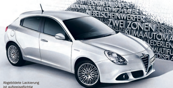
Abgebildete Lackierung ist aufpreispflichtig

Alfa Romeo hat ihn – den Kompaktwagen, bei dem alle wichtigen Extras bereits Serie sind. Und das zu einem sensationellen Preis ab € 18.700,-: die Giulietta SUPER 1.4 TB 16V mit 88 kW/120 PS. Zur umfassenden Serienausstattung gehören u. a.: