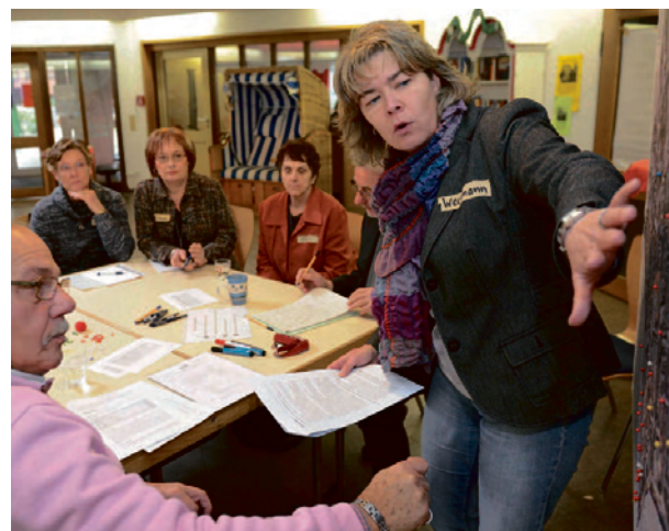
„Älter werden“ ist in Gelsenkirchen ein viel diskutiertes Thema. Wie hier bei der Seniorenkonferenz im Begegnungszentrum der AWO im Januar.