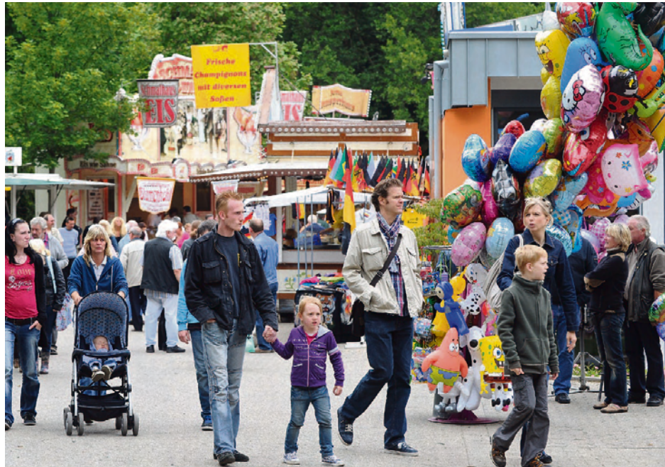
Das Parkfest vom 29. Juni bis zum 1. Juli findet vor der Kulisse des neu gestalteten Gesundheitsparks Nienhausen statt.

Eine Woche später, am Samstag, 31. März , und Sonntag, 1. April , kommt mit