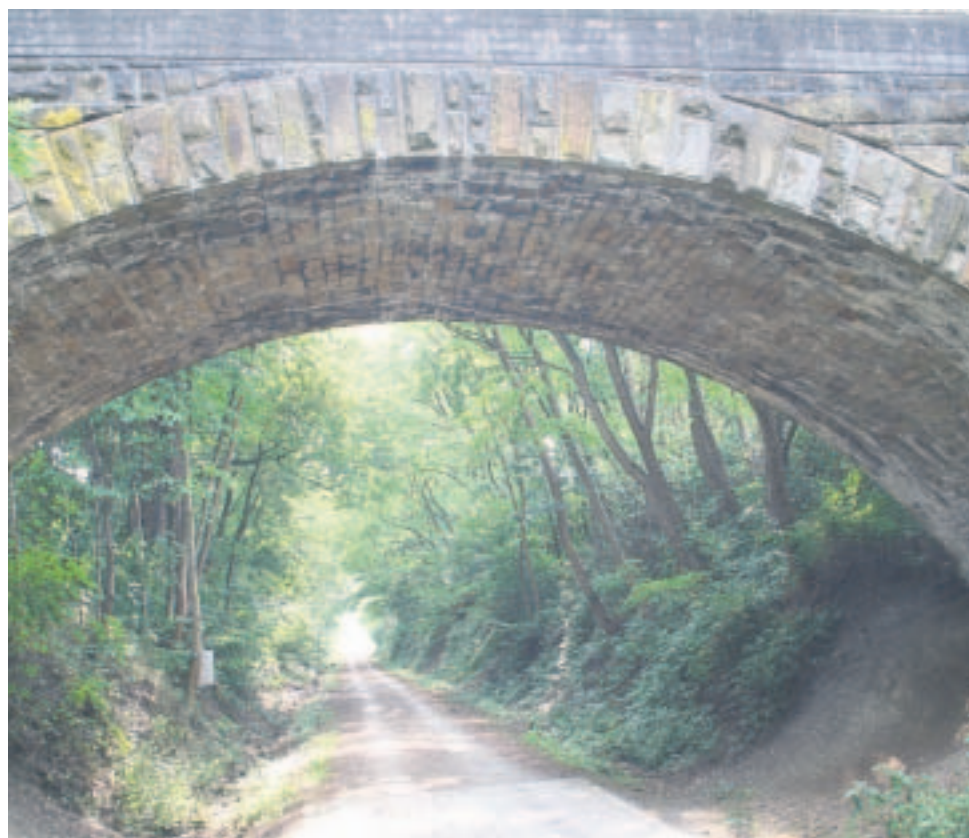
Imposante Strecke: Der Radweg auf der alten Eisenbahntrasse lädt zum Entdecken der frühen Bergbauergangenheit der Region ein.