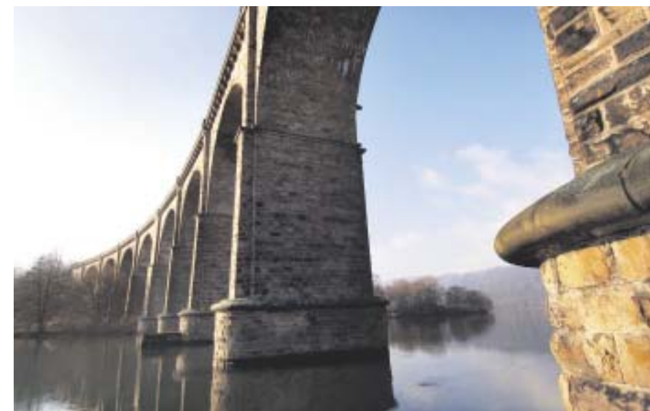
Markantes Bauwerk: Das Ruhr-Viadukt markiert den Beginn des Harkortsees.

Zwischen Wetter und Herdecke erstreckt sich der Harkortsee, auf dem die MS Friedrich-Harkort der Personenschiffahrt Meyer Rundfahrten anbietet. Anlegestellen sind in Herdecke am Zweibrücker Hof, in Wetter kann man am Seeplatz zusteigen. Die Fahrt führt die Ruhr entlang, unter dem Ruhr-Viadukt her, das den Beginn des Harkortsees markiert, und führt dann auf den See. Bei Kaffee und Kuchen und schöner Aussicht auf dem Sonnendeck lässt es sich hier gut entspannen. Segeln, Rudern und Surfen, all das ist