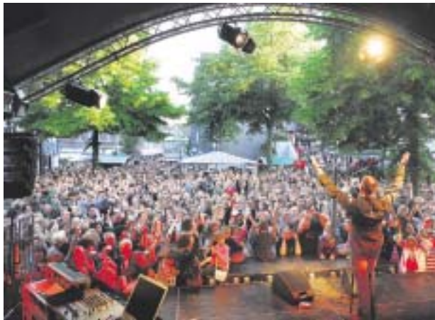
Ramba Zamba in der City: 15 Bands bespielen in diesem Jahr die drei Altstadt-Bühnen der Herdecker Maiwoche.

Neben den musikalischen Veranstaltungen ist der traditionelle Sackträgerlauf eines der Highlights bei der Herdecker Maiwoche. In Erinnerung an die große Bedeutung des Herdecker Kornmarktes vom 17. bis hinein ins 19. Jahrhundert und den hoch angesehenen Beruf des Sackträgers, der die Kornsäcke schleppte, laufen Kinder in Mannschaften, symbolisch mit Säcken ausgestattet, durch den Innenstadtbereich um die Wette. Anmeldungen