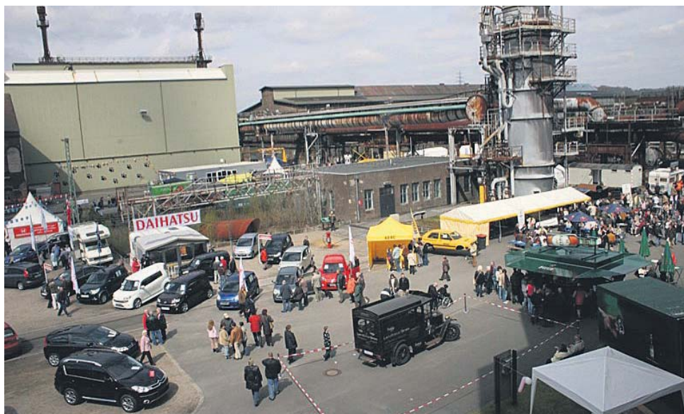
Neueste Modelle der aktuellen PKW- und Motorradsaison sowie schmucke Oldtimer gibt es bei der Autoparty rund um die Henrichshütte zu sehen.

Am 24. und 25. April stehen rund um die Henrichshütte flotte Flitzer und schicke Schätzchen im Mittelpunkt