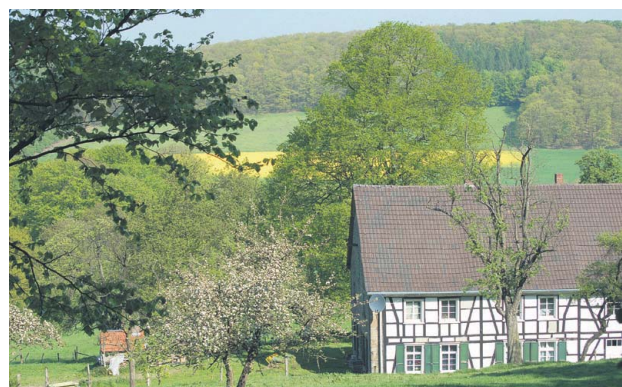
Rad- und Wanderparadies: die Elfringhauser Schweiz.

Das Hattinger Stadtmarketing bieten zahlreiche Stadtführungen an, die Besuchern wie Bewohnern die Stadt unter verschiedensten Aspekten vorstellen. Neben den samstäglich stattfindenden Führungen um 15 Uhr (Treffpunkt ist das Alte Rathaus) werden auch Nachtwächterführungen angeboten.