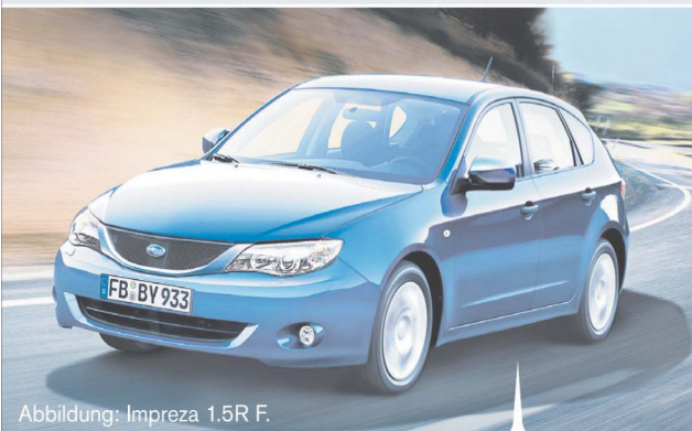
Abbildung: Impreza 1.5R F.