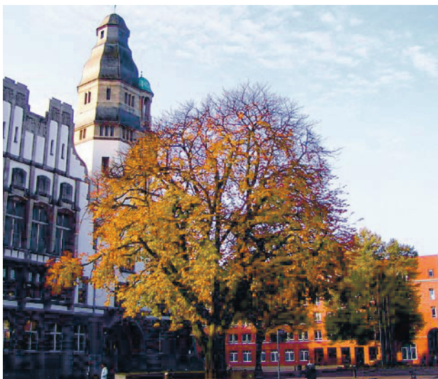
Altes und Neues Rathaus in Gladbeck

Fachbereich Bildung und Erziehung Tel: 02043 / 992615 Bürgermeisterbüro Tel: 02043 / 992748 Fundbüro Tel: 02043 / 992284 Gleichstellungsstelle Tel: 02043 / 992699