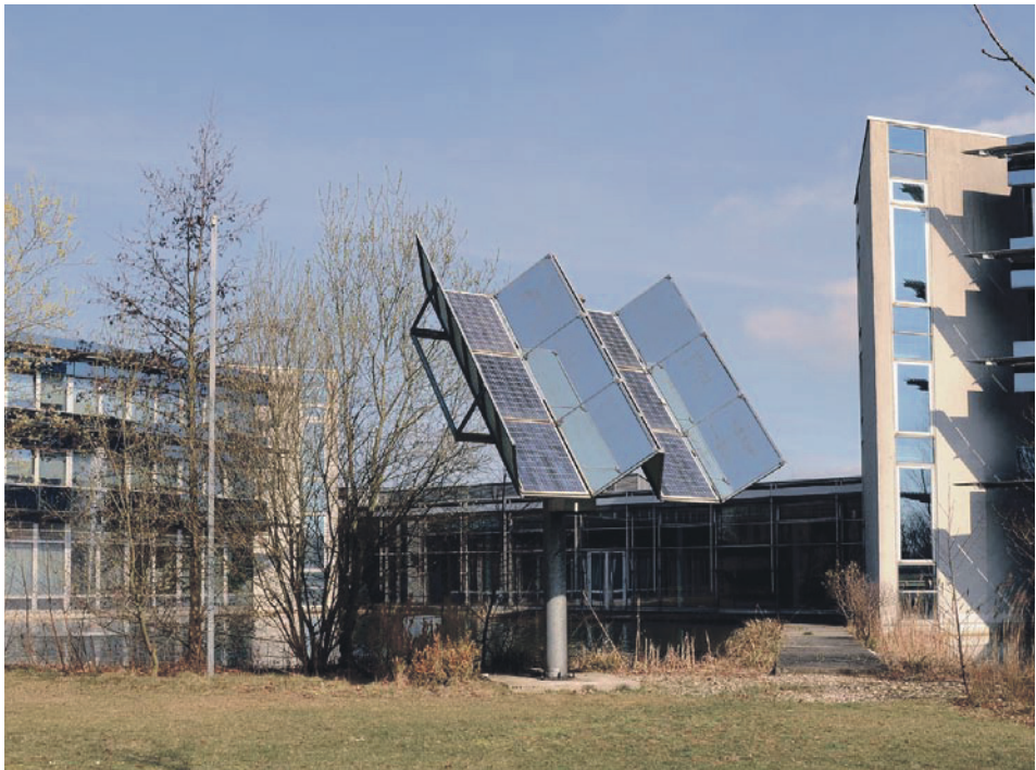
Neben dem Innovationszentrum Wiesenbusch wurde mit dem INNOVA-Park noch ein weiteres Gewerbegebiet erschlossen.

Köppen: An das Gebiet am Innovationszentrum Wiesenbusch schließt sich noch