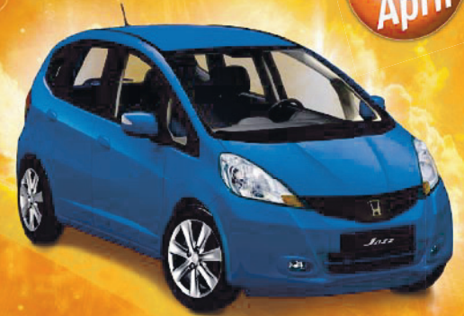
Abb. zeigt Sonderausstattung.