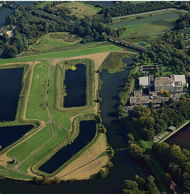
Wassergewinnung für Essens Bürger: Der Bereich Wasserversorgung ist ein wichtiges Standbein der Stadtwerke.

Info: Kundencenter Stadtwerke Essen AG, Rüttenscheider Straße 27-37, 45128 Essen, Tel: 0201 / 800-0, Tel: 0201 / 800-1453 (Tarifkundenberatung), E-Mail: info@stadtwerke-essen.de, Öffnungszeiten: montags bis donnerstags 8 bis 16 Uhr, freitags 8 bis 13 Uhr