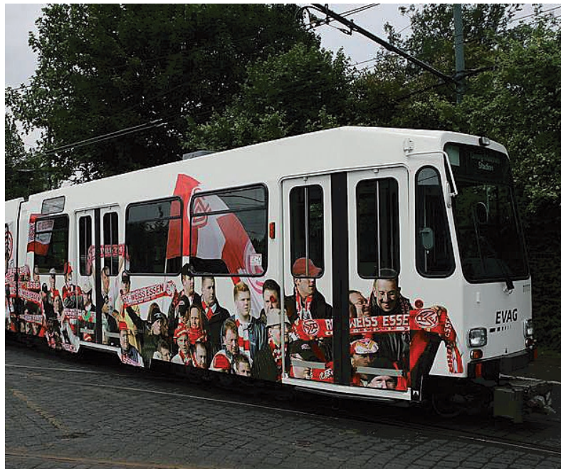
Die RWE-Bahn ist eine von 135 Straßenbahnen in Essen.

Viele Mittel und Wege führen zu den Highlights der Stadt