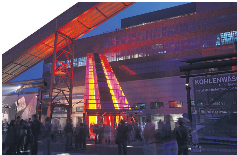
Der Weg der Kohle und der Besucher: Mit der Rolltreppenfahrt auf 24 Metern Höhe beginnt der Besuch im Ruhr Museum auf Zollverein.

Öffnungszeiten: montags bis freitags 9.00 bis 18.00 Uhr samstags 10.00 bis 16.00 Uhr sonntags 10.00 bis 14.00 Uhr