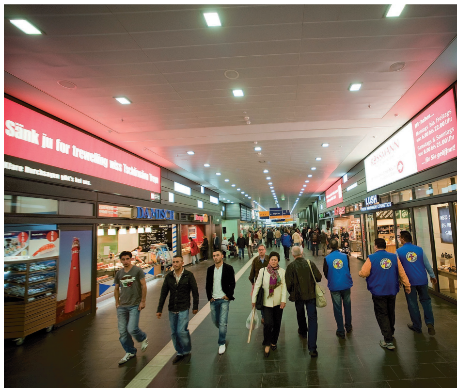
Der Essener Hauptbahnhof hat eine Auffrischung erhalten. Damit hat er deutlich an Aufenthaltsqualität gewonnen.

Unter dem Motto „Essen ist offen“ haben die Geschäfte in der Essener Innenstadt an Samstagen verlängerte Öffnungszeiten: Kunden können dann grundsätzlich bis 18 Uhr einkaufen, einige Häuser öffnen auch bis 20 Uhr.