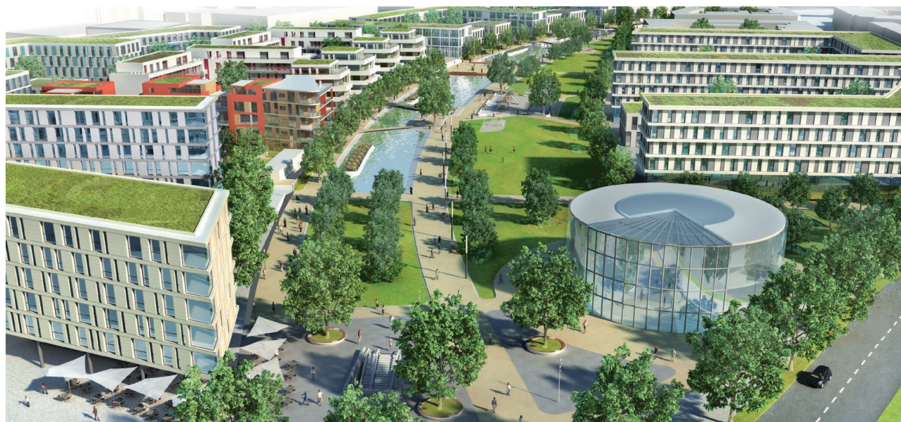
Große Pläne für das Universitätsviertel: Eine eigens gegründete Entwicklungsgesellschaft Universitätsviertel Essen mbH plant das Viertel. Gesellschafter sind die Stadt Essen, die Sparkasse Essen, die EWG - Essener Wirtschaftsförderungsgesellschaft mbH und die Altstadt Baugesellschaft.

Das neue „Universitätsviertel - grüne mitte Essen“ profitiert in außerordentlicher Weise von der umliegenden Infrastruktur. Die Essener City, das Einkaufszentrum Limbecker Platz und zahlreiche Kultur- und Gastro-