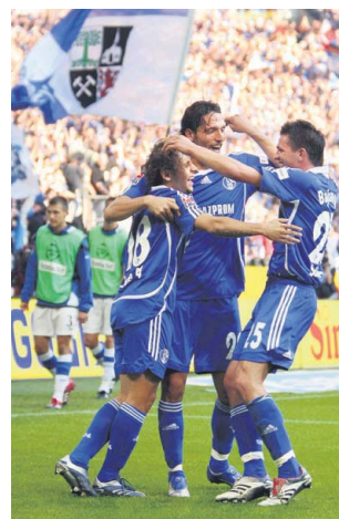
Schalcker Jubel in der Arena.

Über 13 Millionen Menschen besuchten inzwischen die rund 250 Veranstaltungen in der Arena seit ihrer Eröffnung. Die UEFA wählte das Stadion auf dem Berger Feld als Austragungsort des Champions-League-Finales