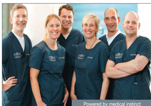
Powered by medical instinct

■ VHS Bochum Gustav-Heinemann-Platz 2-6, 44787 Bochum, Tel. 0234/ 910-1555, Internet: www.vhs-bochum.net