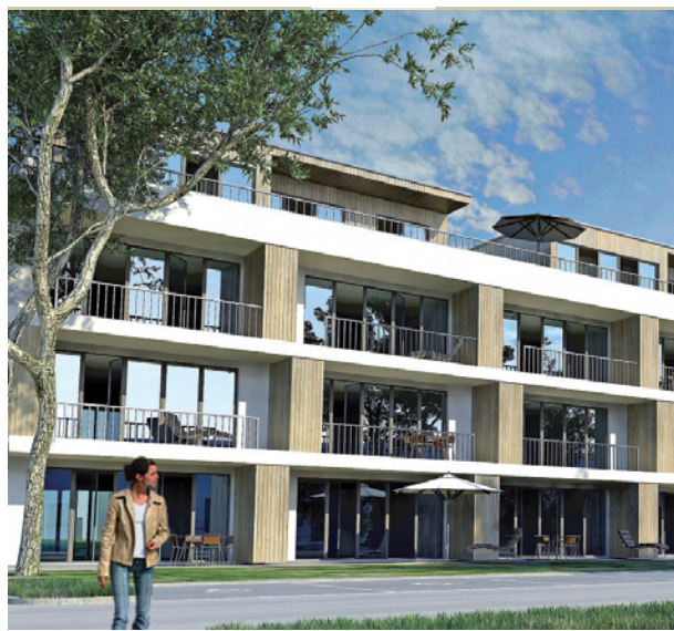
Stadtwohnungen auf dem ehemaligen Bogestra-Gelände.

Ein Spielplatz und die städtische Kindertagesstätte, die gerade an der Brünelstraße entsteht, soll das Areal für junge Familien attraktiv machen. Das Gebiet liegt