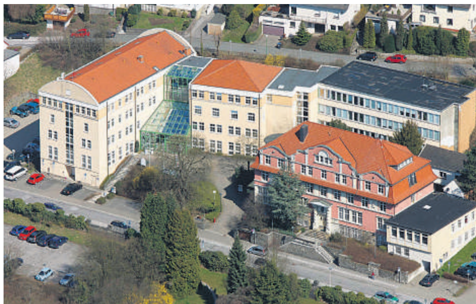
Das Rathaus der Stadt Ennepetal erstreckt sich über drei Verwaltungsgebäude.

Wo bekomme ich einen neuen Personalausweis? Wie bekomme ich eine Schankgenehmigung? Wo kann ich Fundsachen abgeben oder nach Verlorenem fragen? Der Bürgerservice (Fachbereich 2) der Stadt Ennepetal hilft bei diesen und vielen anderen Anliegen weiter. Auf der Internetseite der Stadt, www.ennepetal.de , finden Sie direkt auf der Startseite unter der Rubrik „Bürgerservice“ viele Informationen zu häufig gefragten Themen. Auch Formulare vom Anmelden eines Hundes bis zur Bewerbung als Wahlhelfer stehen dort zum Herunterladen bereit.