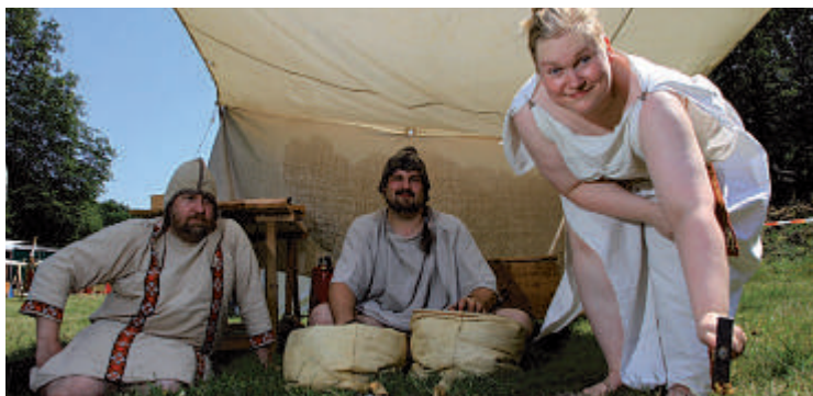
Lagerleben im Römerlager Oberaden.