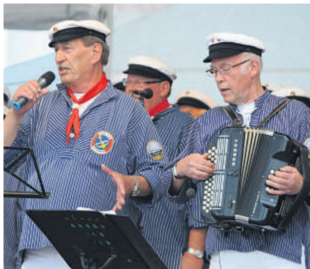
Maritime Klänge stehen am Sonntag auf dem Programm.