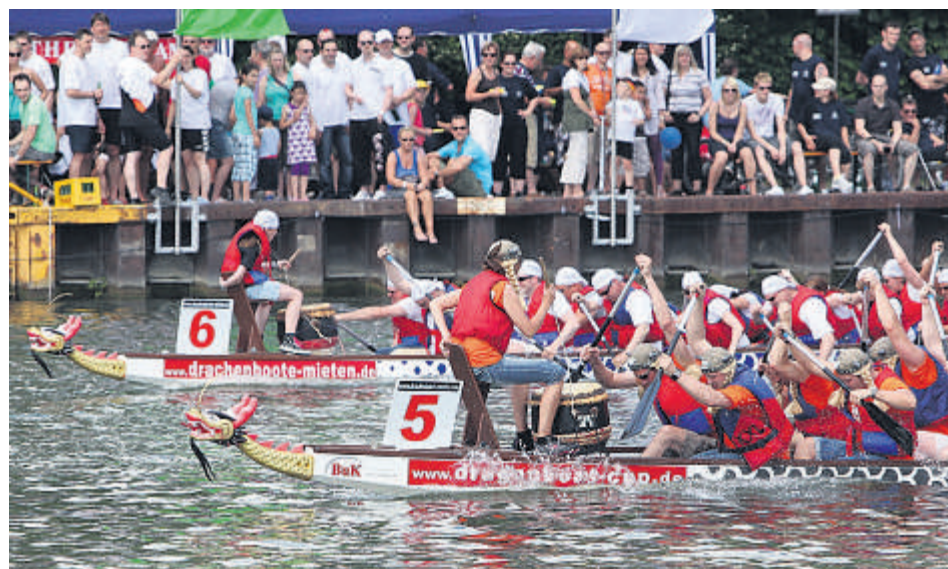
Das erste Drachenbootrennen findet bereits an Christi Himmelfahrt (2. Juni) statt.

nur auf dem Kanal und am Ufer abspielen. Erstmals wird es einen Rundweg durch das gesamte Marina-Gelände geben, an dem überall attraktive Aussteller warten werden – etwa das größte mobile Aquarium Europas. Der Verband für Fischerei und Gewässerschutz in Baden-Württemberg wird sein 60 000 Liter fassendes, zwölf Meter langes Aquarium auf dem Hafengeweg aufbauen. Dort können sich die Besucher dann Hunderte von Fischen ansehen und