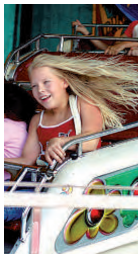
Kirmesspaß für Jung und Alt in der Wittener City.

R und um die Zwiebel drehen sich vom 2. bis 5. September die Ereignisse in der Wittener Innenstadt – kann doch die Zwiebelkirmes auf eine rund 600-jährige Tradition zurückblicken. Zwar sah die Kirmes zu der damaligen Zeit wohl etwas anders aus, aber Spaß und Spiel für Kinder und Erwachsene gibt es auch nach vielen Jahrhunderten noch auf dem großen Stadtfest. Los geht's mit einem historischen Umzug (3.9., 15.30 Uhr), bei Gaudiwettbewerben können sich kleine und große