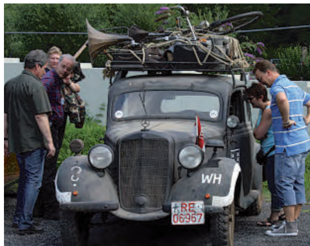
Liebevoll inszeniert präsentieren die Oldtimerfreunde ihre Fahrzeuge an der Zeche Nachtigall.

Wer sein Glück versuchen will, kann an der großen Verlosung teilnehmen und als Hauptpreis einen Mini Cooper 1.3i im Wert von über 6000 Euro gewinnen. Ein besonderes Schmankerl ist das Mercedes-Treffen, das anlässlich der Erfindung des Automobils vor 125 Jahren bereits am Freitag, 19. August, stattfinden wird. Begleitet wird die Veranstaltung, die um 18 Uhr beginnt, von einem Musikprogramm.