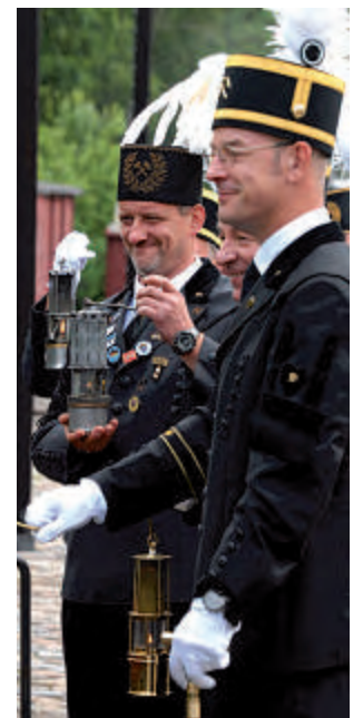
Glück auf! Knappentag auf Zeche Nachtigall am 3. Juli.

Am Samstag, 9. Juli , präsentiert sich die Zeche im Rahmen der ruhrgebietsweiten „ Extraschicht “ im Stile Südamerikas mit argentinischer Kunst, brasilianischen Rhythmen und vielem mehr. Weitere Informationen zur Zeche Nachtigall und zum Programm der Extraschicht finden sie auf Seite 10 in diesem Heft und im Internet auf der Seite www.lwl.org .