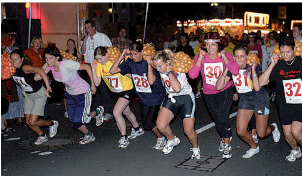
Beim Zwiebelsackträgerlauf sind Kondition und Humor gefragt.

587. Wittener Zwiebelkirmes vom 2. bis zum 5. September