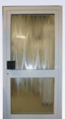
DIN Links 1100 x 2150 mm 673,- € inkl. 19% MwSt.

Poststr. 155 · 46562 Voerde-Friedrichsfeld · Tel.: 0281/94 30 90 · Fax: 0281/94 30 91 Internet: www.spinneken.com · E-Mail: info@spinneken.com