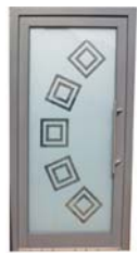
DIN Rechts 1080 x 2120 mm 1.737,- € inkl. 19% MwSt.