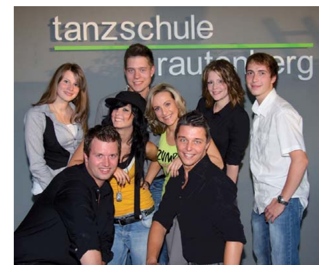
Das Team der Tanzschule.

Vor allem für Jugendliche gibt es ein besonderes Paket: Auch hier steht wieder praxisnahes Tanzen auf dem Stundenplan. Neben dem Tanzkurs erwartet die 14 bis