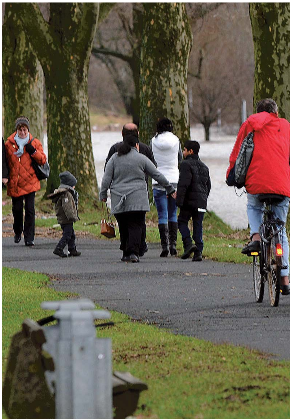
Am Rheinufer bei Götterswickerhamm kommen Wanderer, Spaziergänger und Radfahrer zu jeder Jahreszeit auf ihre Kosten.