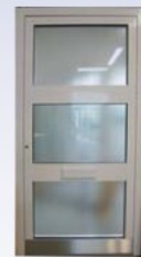
DIN Links 1070 x 2140 mm 1.487,- € inkl. 19% MwSt.