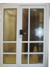
DIN Links 1730 x 2000 mm 1.428,- € inkl. 19% MwSt.