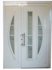
DIN Links 1600 x 2150 mm 3.451,- € inkl. 19% MwSt.