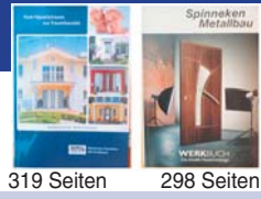
319 Seiten 298 Seiten

Holen Sie sich Ihre großen Haustür-Kataloge kostenlos bei uns ab: