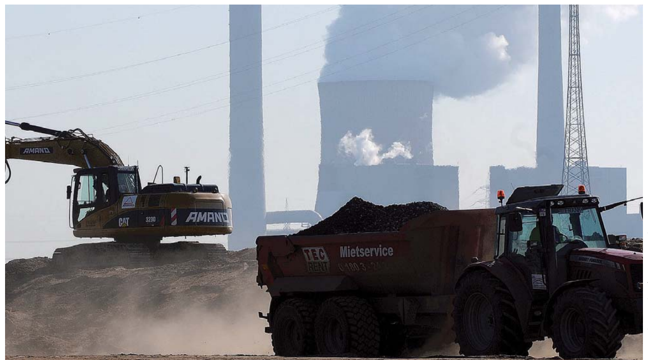
Ein Drei-Zonen-Deich ist das Ziel der Deichsanierung Mehrum. Wasserseitig schützt eine zwei Meter dicke Lehmdichtung, innen wird durchlässiges Material verarbeitet, eindringendes Wasser kann durch eine vorgelagerte Drainage abfließen.

■ Informationen: Deichverband Mehrum Weseler Straße 78, 46562 Voerde, Tel: 0281/948237