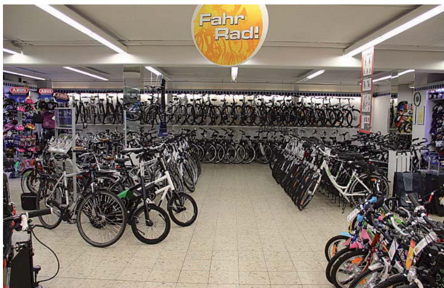
Auch in Voerde stehen dem Kunden zahlreiche Markenräder zur Verfügung.

Seit Anfang Oktober werden nun in Wesel am Kornmarkt die eigenen Geschäftsräume von ehemals Netto zum neuen Fahrradgeschäft 2-Rad Vorstius umgebaut. Nach umfangreichen Arbeiten wird 2-Rad Vorstius hier den endgültigen Standort in Wesel im Januar beziehen.