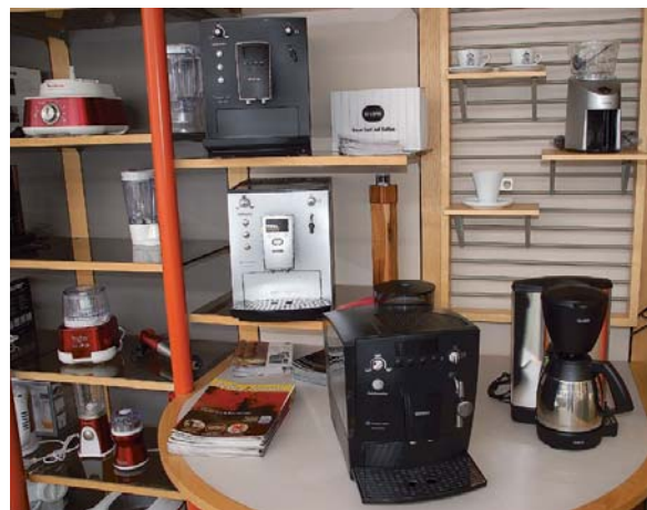
Auch Kleingeräte hat Horst Prommensberger am neuen Standort jetzt im Angebot.

begebiet an der Grenzstraße in Frage, denn das Ein- begeben zu gelangen. Für mich kommt nur die Einkaufsstraße in Frage, denn das Ein- kaufen sollte sich vor allem im Ortskern abspielen.“