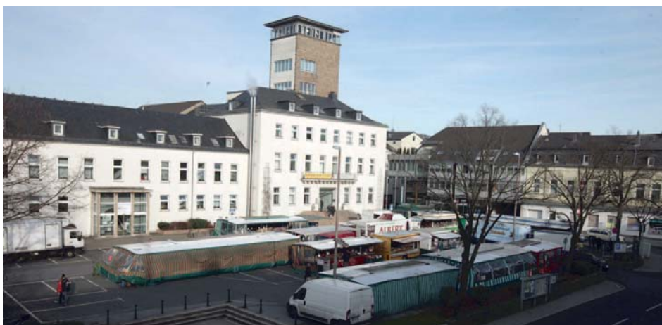
Der Rathauskomplex in Velbert-Mitte mit Wochenmarkt auf dem Rathausvorplatz.