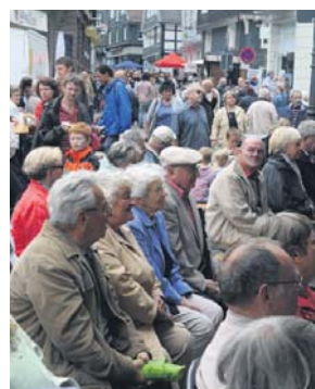
Das Sommerfest in Langenfeld lockt viele Besucher.

Bereits zum 23. Mal gehören vier Tage den edlen Tropfen aus dem rheinland-pfälzischen Langenlohnheim. Von Donnerstag, 9., bis