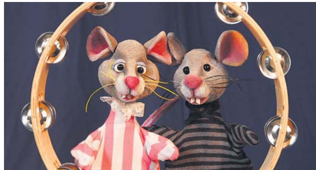
„ Stadtmaus und Landmaus “ für Kinder von vier bis acht Jahren.

Speziell für kleine Zuhörer ab fünf Jahren führt das Landestheater Mozarts berühmteste Oper auf und macht aus der „ Kleinen Zauberflöte “ am