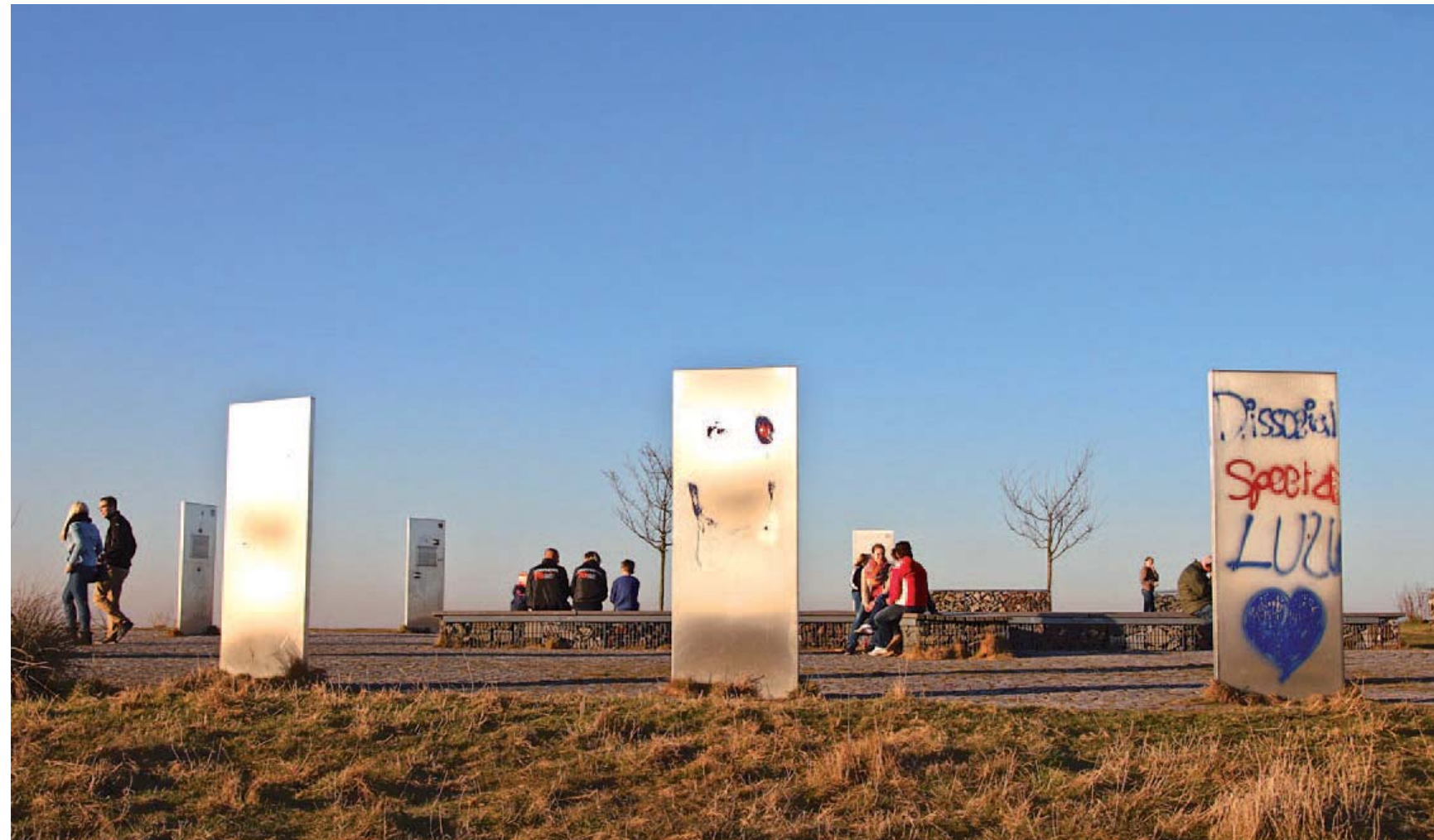
Ein „echter“ Berg mit einem künstlichen Gipfel: Den Tippelsberg umweht eine Magie, die schwer zu greifen ist. Der Panoramablick ist eine Reise wert.

Das allerdings ist eher bescheiden, zum Teil leicht lädiert und nicht unbedingt der Reise wert. Vielmehr ist es der