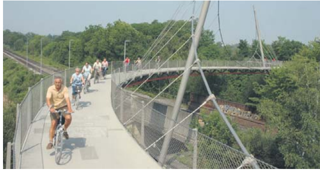
Wer Rad fährt, schont die Gelenke und absolviert ein effektives Herz-Kreislauf-Training.