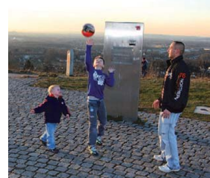
Hoch hinaus: Und von oben dann die freie Sicht aufs Ruhrgebiet genießen!

„Du bist keine Schönheit, vor Arbeit ganz grau“, sang der Wahl-Bochumer Herbert Grönemeyer anno 1984. Schon richtig. Doch was wäre das Landschaftsbild eigentlich ohne diese gewaltigen markanten Überbleibsel? Sicher, da wären Kirchen, der Bismarckturm im Stadtpark, ein paar Flutlichtmasten – aber sonst? Selbst die Topographie des Umlandes, mit seinen vie-