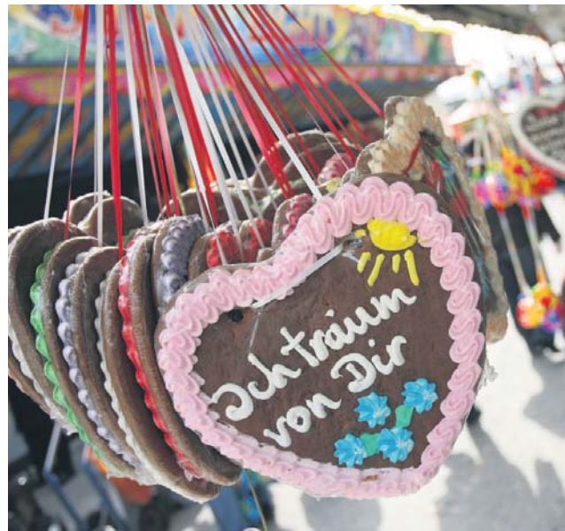
Linden lädt mit rund 30 Attraktionen ein zur Frühjahrskirmes vom 3. bis 6. Mai.

Kulinarik, Kunst und Kultur stehen im Mittelpunkt des Gerther Sommers am Samstag, 15. Juni , von 10 bis 16