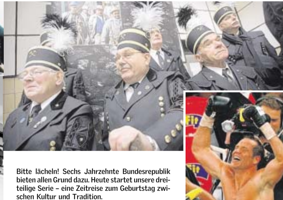
Bitte lächeln! Sechs Jahrzehnte Bundesrepublik bieten allen Grund dazu. Heute startet unsere dreiteilige Serie – eine Zeitreise zum Geburtstag zwischen Kultur und Tradition.