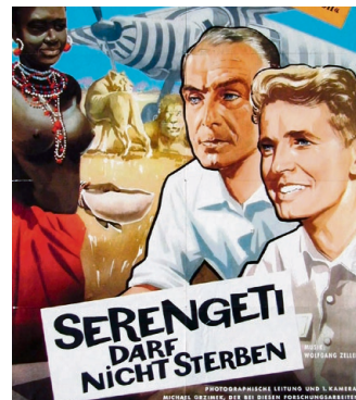
Oscar-Gewinner: Grzimek mit „Serengeti darf nicht sterben“.

Auch in diesem Gesetz spiegelt sich deutsche Gründlichkeit, mit der Bernhard