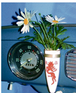
Autovasen waren der Hit.

Der Käfer wird zum Alpen-Bezwinger und ein Sinnbild für eine neu gewonnene Freiheit, die Deutschland mit süßem Wein und eingängiger Schlagermusik feiert. La Dolce Vita, das süße Leben, der Film, in dem Regisseur Federico Fellini 1960 den konsumorientierten und egoistischen Menschen an den Pranger stellt, ändert an den Sehnsüchten nichts. Nein, der Film befeuert die Wünsche der Deut-