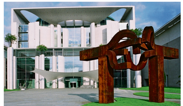
Die Architektur des Kanzleramts zeigt: Es war mehr als ein Regierungsumzug von Bonn nach Berlin.