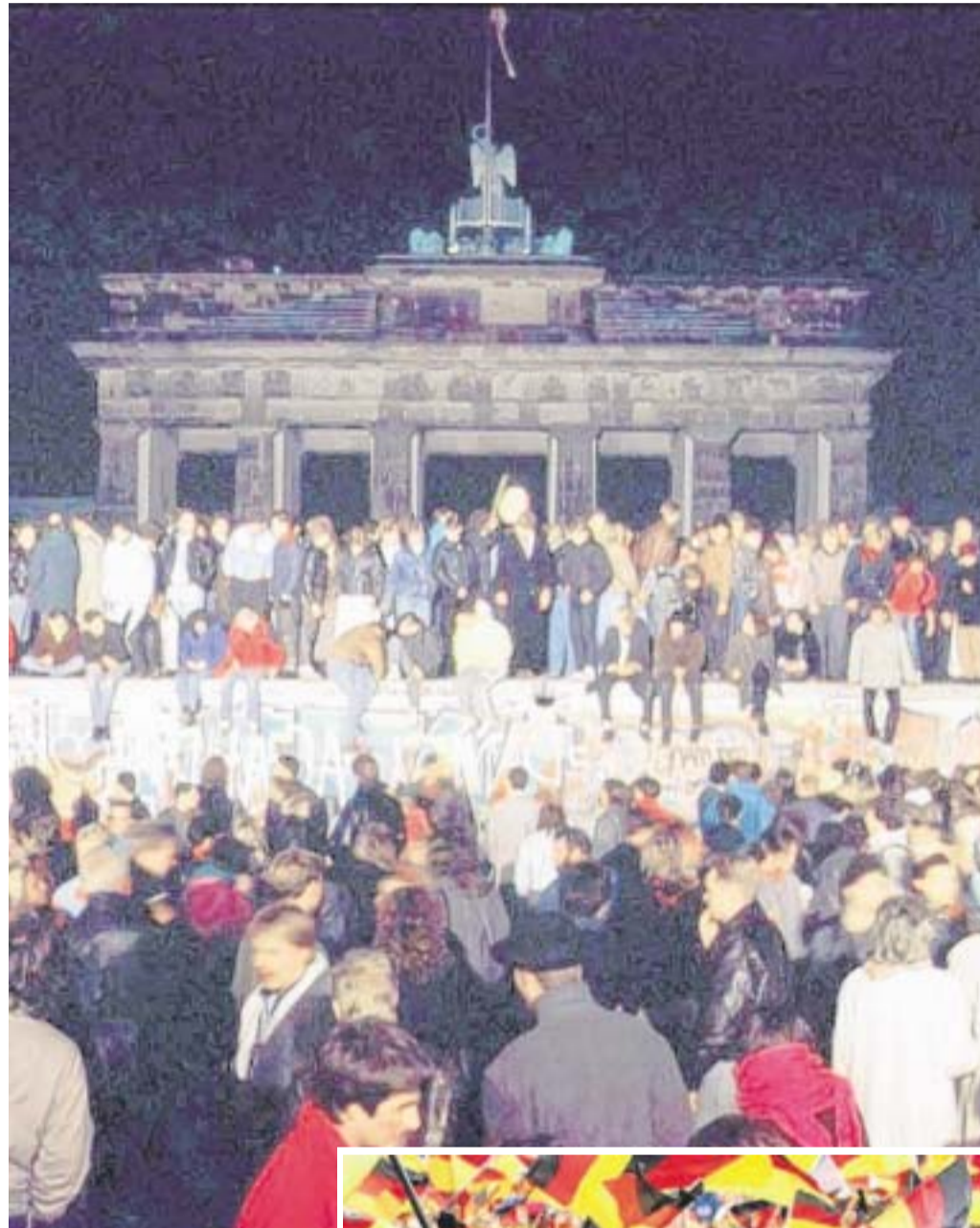
Einmal durch die Jahrzehnte: Von Ludwig Erhard (unten) über den Fall der Mauer 1989 bis zur märchenhaften Fußball-WM 2006 im eigenen Land.