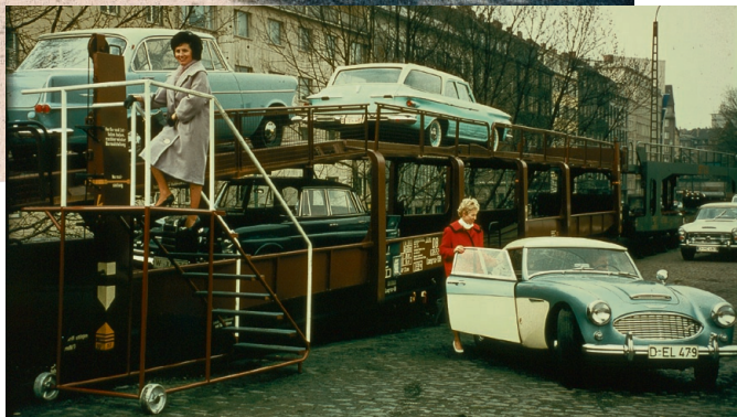
Im Autoreisezug (r.) zeigt sich die Dame von Welt modebewusst. Wer es weniger exklusiv wollte, erklimm mit dem VW Käfer die Alpen und kam so ans Ziel seiner Träume.