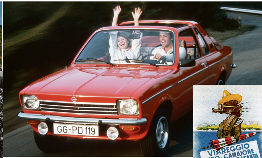
Urlaub, Mode, Automobil: Das Wirtschaftswunder legte den Grundstein für diese zum Teil sehr ausgeprägten Leidenschaften der Deutschen.