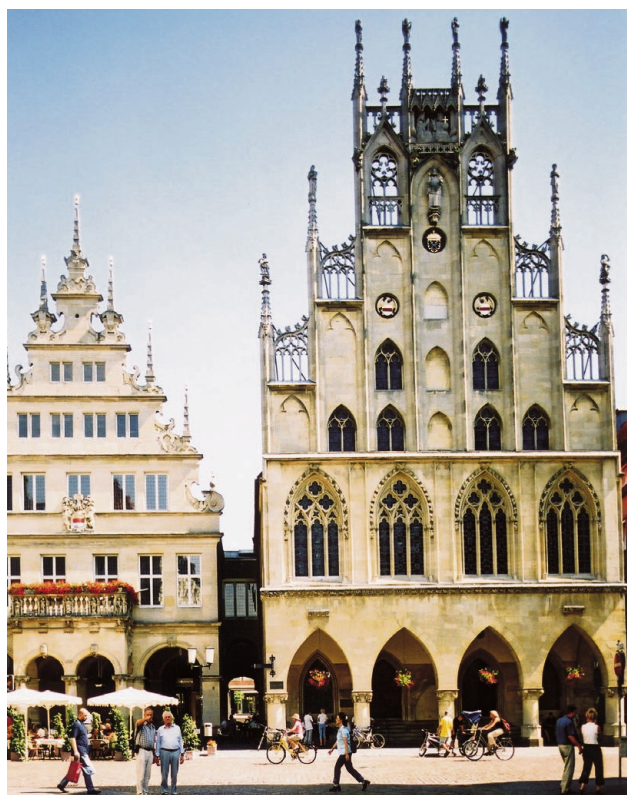
Gotische Giebel laden zum Geldausgeben: Münster baute die im Zweiten Weltkrieg zerstörte Innenstadt nach dem historischen Vorbild wieder auf.

Info: Zeche Zollverein, Gelsenkirchener Straße 181, 45309 Essen, Tel.: (0201) 30 10 4-25, Internet: www.red-dot.org, Öffnungszeiten: Dienstag bis Donnerstag, 11 bis 18 Uhr, Freitag bis Sonntag und an Feiertagen, 11 bis 20 Uhr, Eintritt 5 Euro