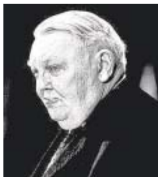
Ludwig Erhard – der selbst ernannte Vater des Wirtschaftswunders.

Häufig ist heute vom Mangel an Visionen die Rede. Die Gründerväter der jungen Republik indes bewiesen in der Nachkriegszeit einen Weitblick, der seinerzeit geradezu phantastisch anmuten musste: Ausgerechnet jene Deutschen,