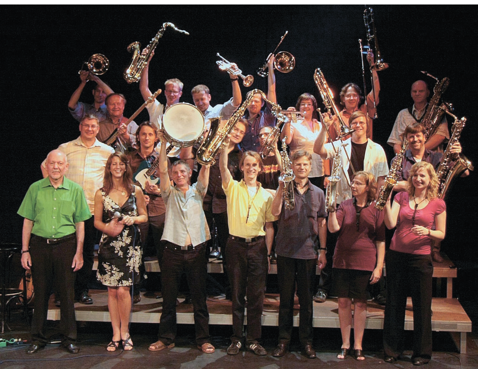
Die Bochumer Blechbläser sind ein Projekt der Musikschule Bochum.

Wer Lust auf eine professionell aufgenommene Scheibe hat, sollte die eigenen Songs, egal welcher Stilrichtung, als MP3-File per E-Mail an info@sparda-west.de oder auf CD-Rom per Post an Sparda-Bank West, Stichwort „Talent Award“, Ludwig-Erhard-Allee 15, 40227 Düsseldorf, schicken.