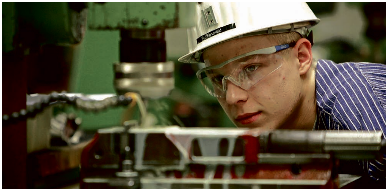
Technische Berufe sind nach wie vor beliebt bei den Jugendlichen. Aber auch hier gibt es mehr Bewerber als freie Stellen.