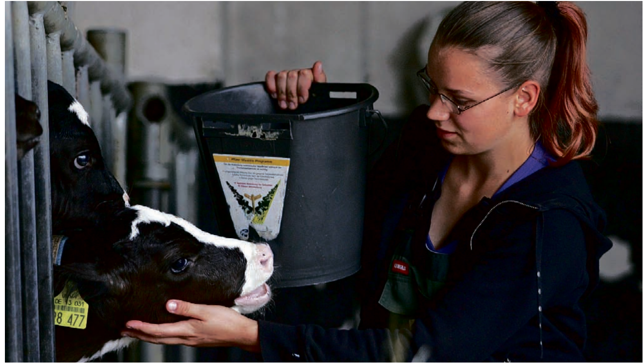
Traumberuf Landwirtin: Wer für seine Ausbildungsstelle umziehen muss, kann eine Ausbildungsbeihilfe beantragen.

Ein Antrag auf Berufsausbildungsbeihilfe ist jederzeit möglich