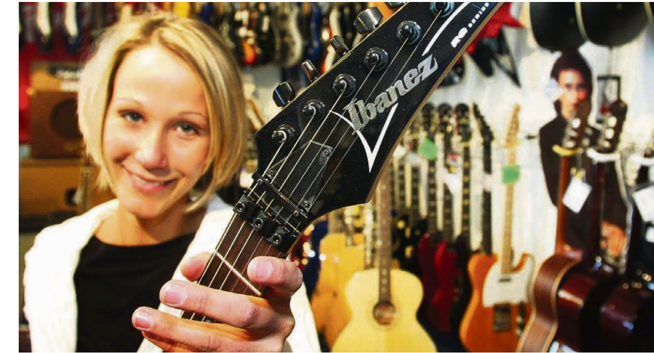
Die guten „Saiten“ einer vielfältigen Ausbildung: Musikfachhändler können später in vielen Bereichen arbeiten.

Eine musische Veranlagung darf also vorausgesetzt werden, wenn man den Beruf ergreift. In der Berufsschule wird sie ergänzt durch Kenntnisse der Musikgeschichte; auch das Notenlesen und Harmonielehre gehören auch dazu. Im zweiten Lehrjahr bekommen