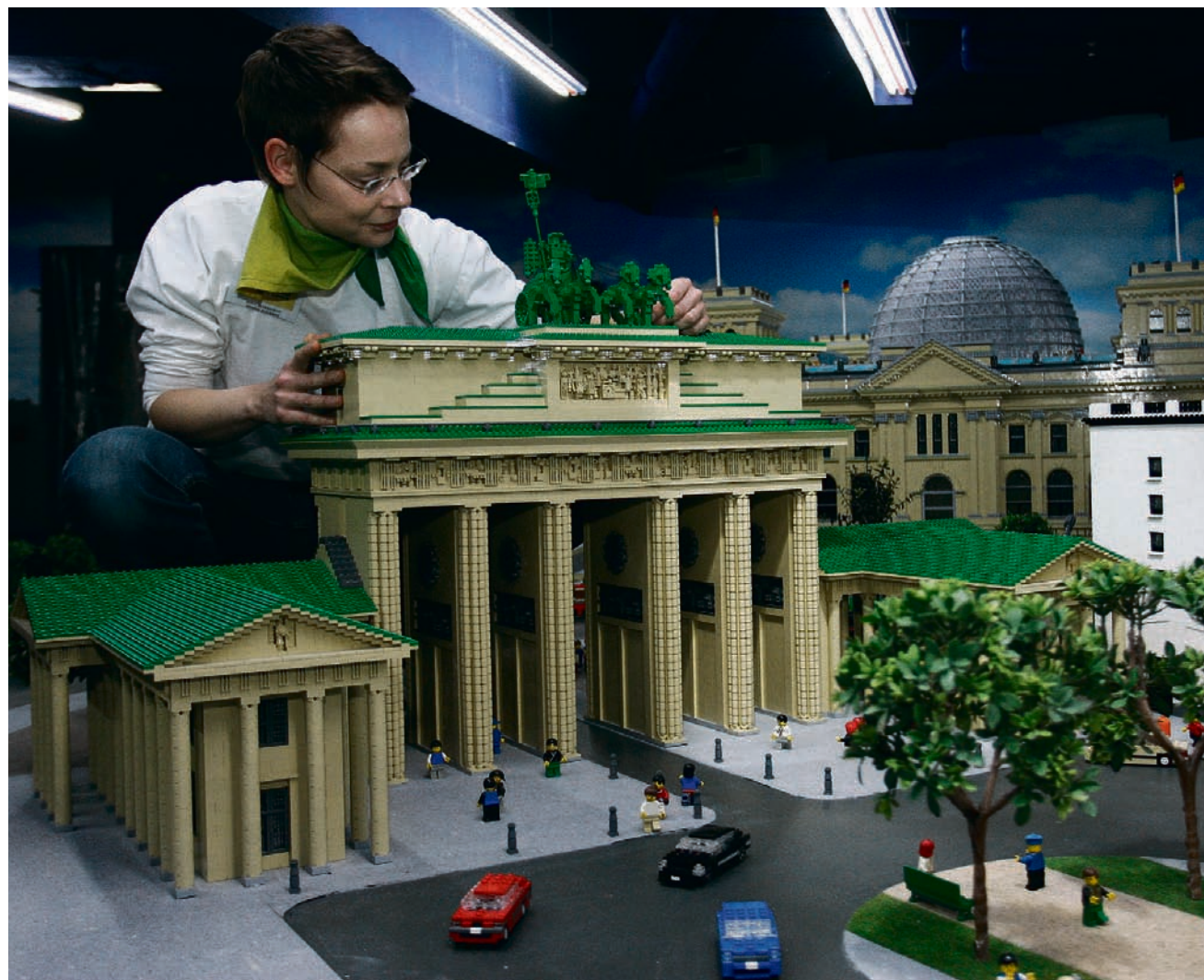
Nur für Spielkinder? Von wegen! Für den neuen Ausbildungsberuf der Technischen Modellbauerin braucht es handwerkliches Geschick, logisches Denken und Kreativität. Objekte wie auf diesem Foto dürften trotzdem nur selten auf dem Plan stehen.

Neuer Ausbildungsberuf: Technische Modellbauer schaffen Wunderwerke