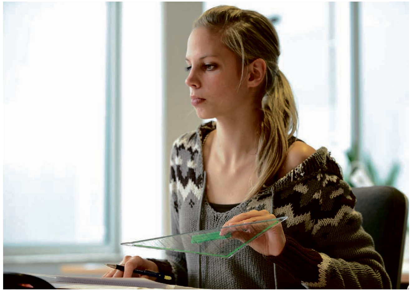
Kreative Büroberufe sind bei den Jugendlichen beliebt. Ganz anders sieht es bei Jobs aus, bei denen körperliche Arbeit oder soziale Tätigkeiten im Vordergrund stehen: Hier ist die Nachfrage nach Ausbildungsstellen weitaus geringer.

Ausbildungsberufe wie Gestalter für visuelles Marketing, Mediengestalter, Tierpfleger oder auch Fotograf sind bei den Jugendlichen weiterhin sehr gefragt - und dies wird nach Einschätzung des BIBB auch so bleiben. Große Nachwuchsprobleme haben dagegen bereits heute verschiedene Ausbildungsberufe im gewerblichen Bereich - insbesondere im Reinigungsgewerbe und im Nahrungsmittelhandwerk. Aber auch in den Gastronomieberufen sieht es nicht besonders gut aus. In manchen