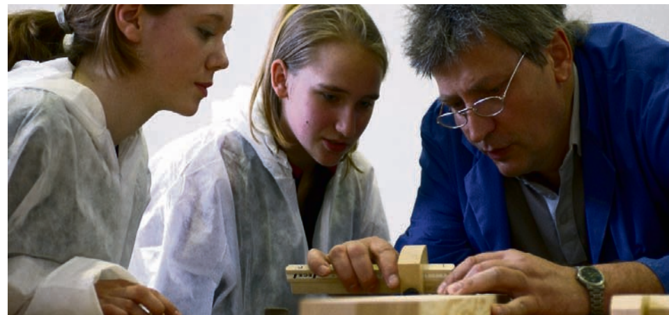
Praktika sind wichtig zur Orientierung, sollten aber kein Dauerzustand werden.

▣ Initiative Fair Company - Infos zu den Regeln der Fair Companys: www.karriere.de/fair-company