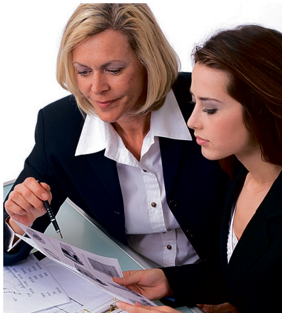
Kaufleute für Personaldienstleistungen planen strategisch und kommunizieren mit den Mitarbeitern, sie recherchieren Jobbörsen und übernehmen Verwaltungsaufgaben.

Die Internetseite enthält außerdem Übungen und Checklisten. Im Chatroom können Jugendliche ihre Fragen zum Bewerbungsprozess mit Experten aus der Wirtschaft und Berufsberatern klären. ddp