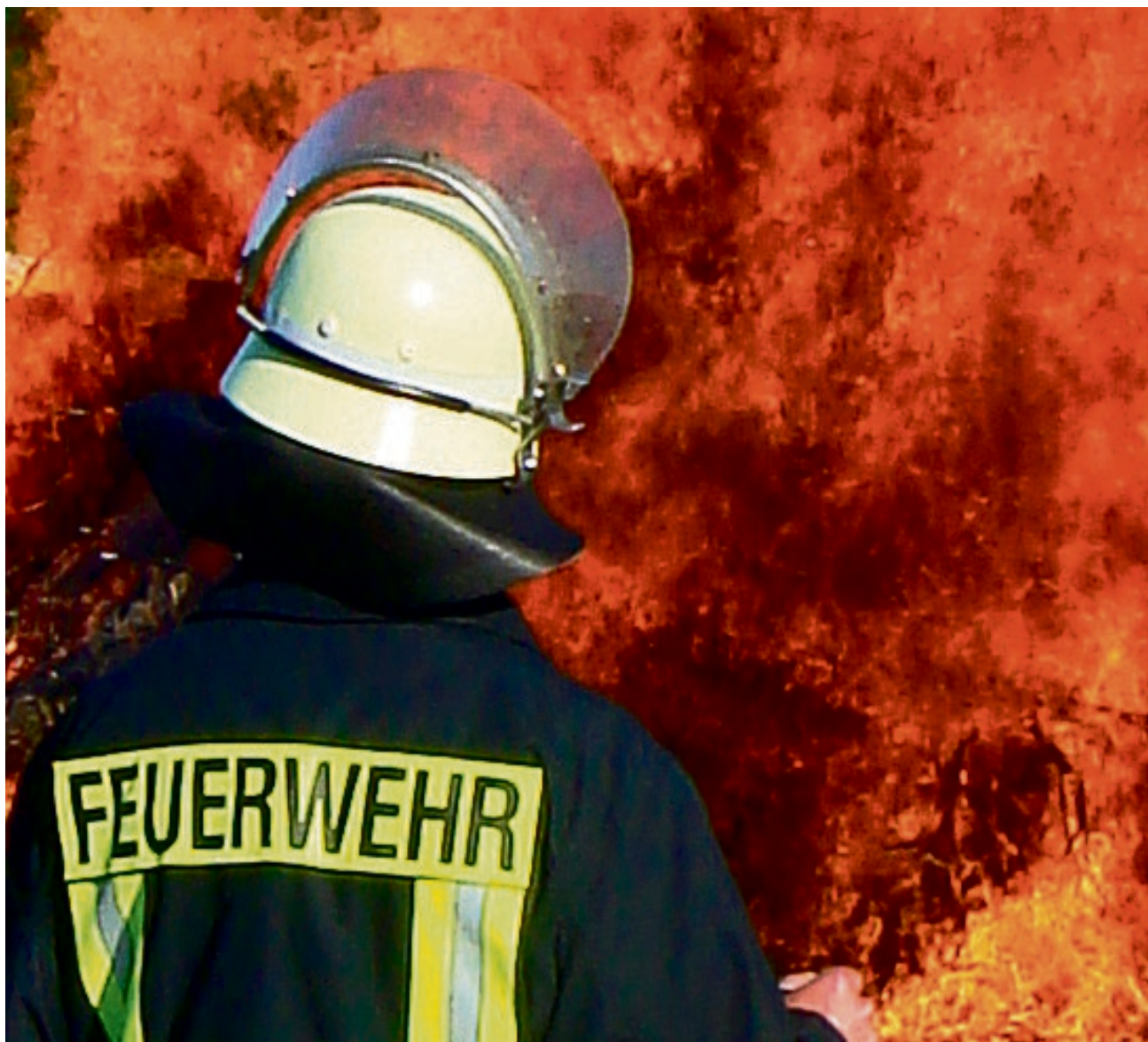
Feuer und Flamme sollen zukünftige Werkfeuerwehrleute für Ihren – nicht ungefährlichen – Beruf sein.

Werksfeuerwehrleute erhalten zum ersten Mal eine einheitliche Ausbildung